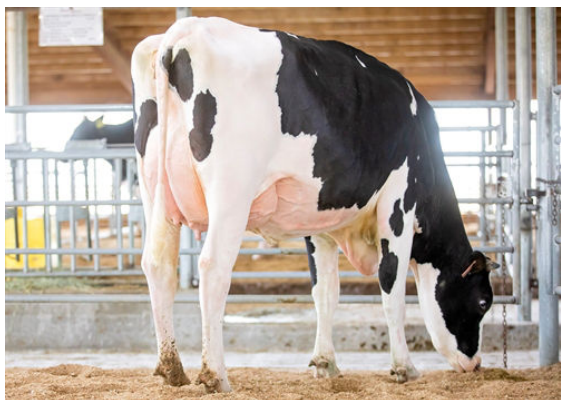
WINSTAR CLARITY 5610 DAM