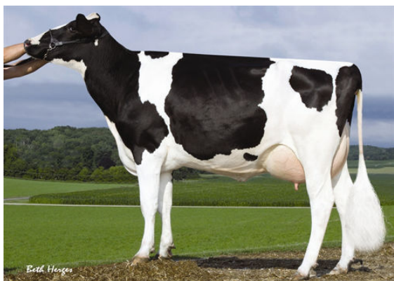
SANDY-VALLEY PLANE SAPPHIRE FIFTH DAM