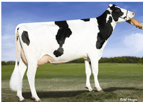
SANDY-VALLEY ROBUST RUBY FOURTH DAM